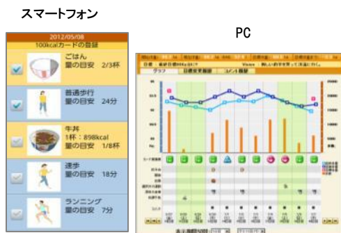
②生活記録イメージ