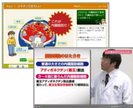
①学習コンテンツイメージ