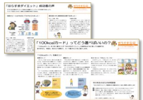
③情報発信メールイメージ (添付ファイル)

※学習コンテンツの一部はPCのみからの閲覧になります ※PCにはAdobe® Flash® Playerが必要になります ※情報発信メールに添付される添付ファイルはPC宛メール向けのみになります